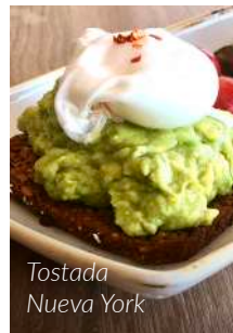
Tostada Nueva York